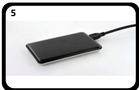
Connectez le disque dur à votre ordinateur à l'aide du câble fourni. Formatez celui-ci dans le format de votre choix (via Gestionnaire de disques sous Windows et Utilitaire de disque sous Mac OS).