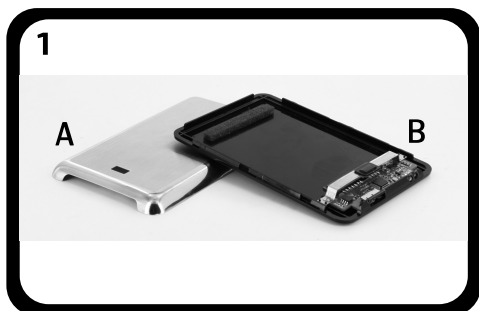
A : Coque basse B : Coque haute