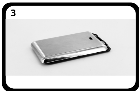
Remplacez la coque basse.