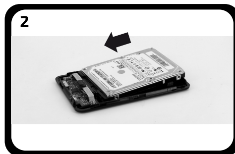
Suivez le sens de la flèche pour bien enficher le disque dur sur le connecteur SATA.